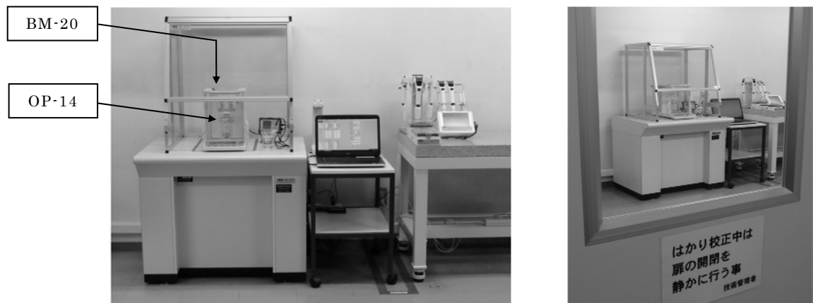
Fig.1 容量テスター関連設備/ピペット校正室

被試験ピペットとして電動ピペット：MPA-200（容量200 \mu L）を利用し、また被測定チップとして、PP製標準チップとチップ表面をシリコン処理した、『シリコナイズチップ』を用意した。そして、同一ピペットを使用し、色々な界面活性剤について、リバース動作とブローアウト動作による分注精度の比較を行った。なお、容量テスターとしては、マイクロ天びん：BM20+OP-14（容量テスターキット）と容量計算ソフト“WinCT-Pipette”を利用した。これらの手法についてはISO8655に重量から容量を求める方法として規定されている。（ Fig.1 ）